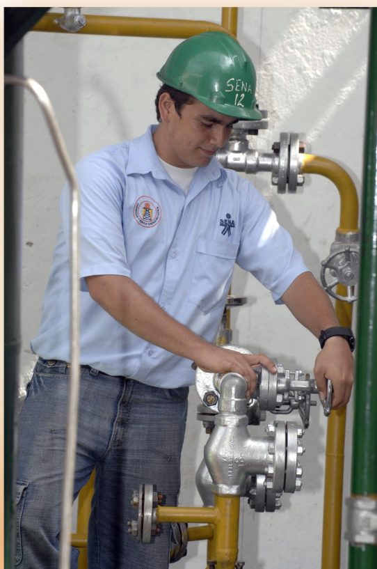
Imágenes suministradas por el Centro Industrial y del Desarrollo Tecnológico - Barrancabermeja.

Las empresas contratistas encargadas de ejecutar el Proyecto de Hidrotratamiento de Combustibles al interior de la refinería de Barrancabermeja, invertirán $478 millones