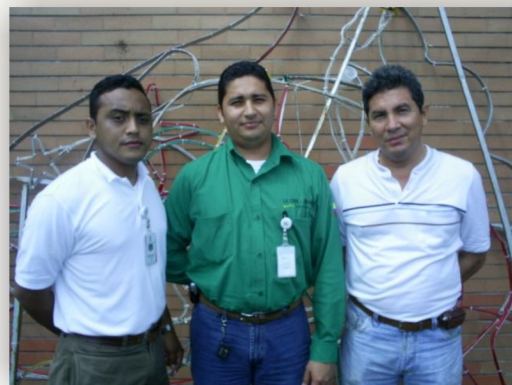
Foto: Liseth Moreno. Practicante Comunicaciones - Centro Industrial y del Desarrollo Tecnológico - Barrancabermeja